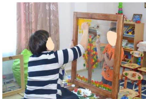
Рис. 5. Совместный рисунок с мамой «Осеннее дерево».

На данном занятии родитель смотрит на мир с позиции ребенка, отрывается от повседневных забот и вместе с ребенком создает продукт совместной творческой деятельности. В памяти через реальные действия закрепляется чувство «я могу понимать», «я могу принимать ребенка», «я могу чувствовать своего ребенка» и в итоге «я могу быть успешным родителем!». Результат совместной творческой деятельности – совместный рисунок – с разрешения родителей запечатлен на фото и видео. Пережитый позитивный опыт, с чувством «я могу быть успешным родителем», создает ресурс в памяти для дальнейшего воспитания ребенка и совершенствования своих родительских компетенций.