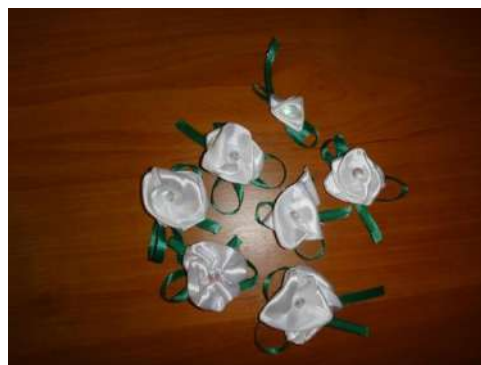
Рис. 7. Белые цветки, изготовленные участниками благотворительного проекта

В общей сложности в подготовленных мероприятиях приняли участие 83 человека из МБОУ гимназия № 161 (обучающиеся, педагоги, родители).