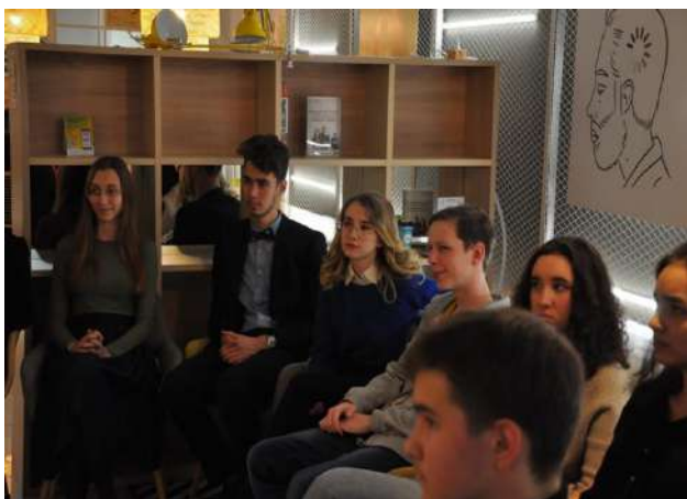
Рис. 9. Участники реализации проекта