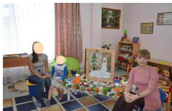
Рис. 3. Совместный рисунок с мамой «Зима пришла»